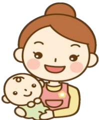
利用者支援専門員